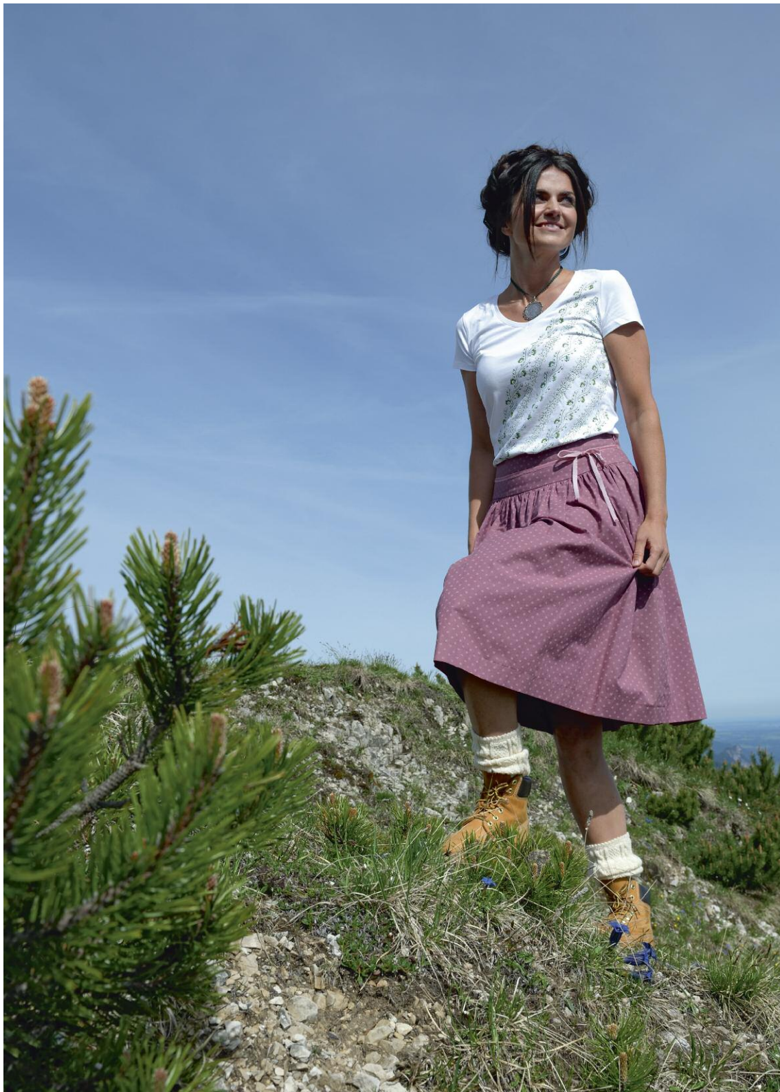
T-Shirt handbedruckt aus Bad Aussee 59,90€, Baumwollrock mit breitem Bund 119€.