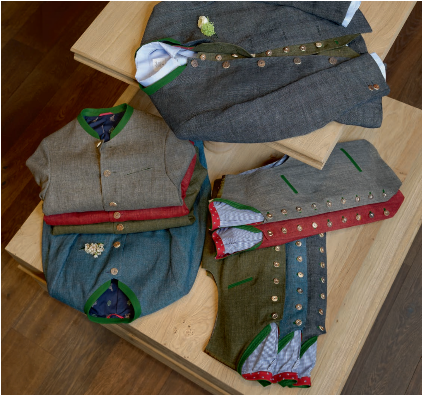
Oben und Rückseite: Schlank geschnittene, halbgefütterte Joppe aus reinem Leinen in fünf Farben, 299 €. Stehkragenweste aus reinem Leinen mit Lodenausputz in fünf Farben, 199 €.