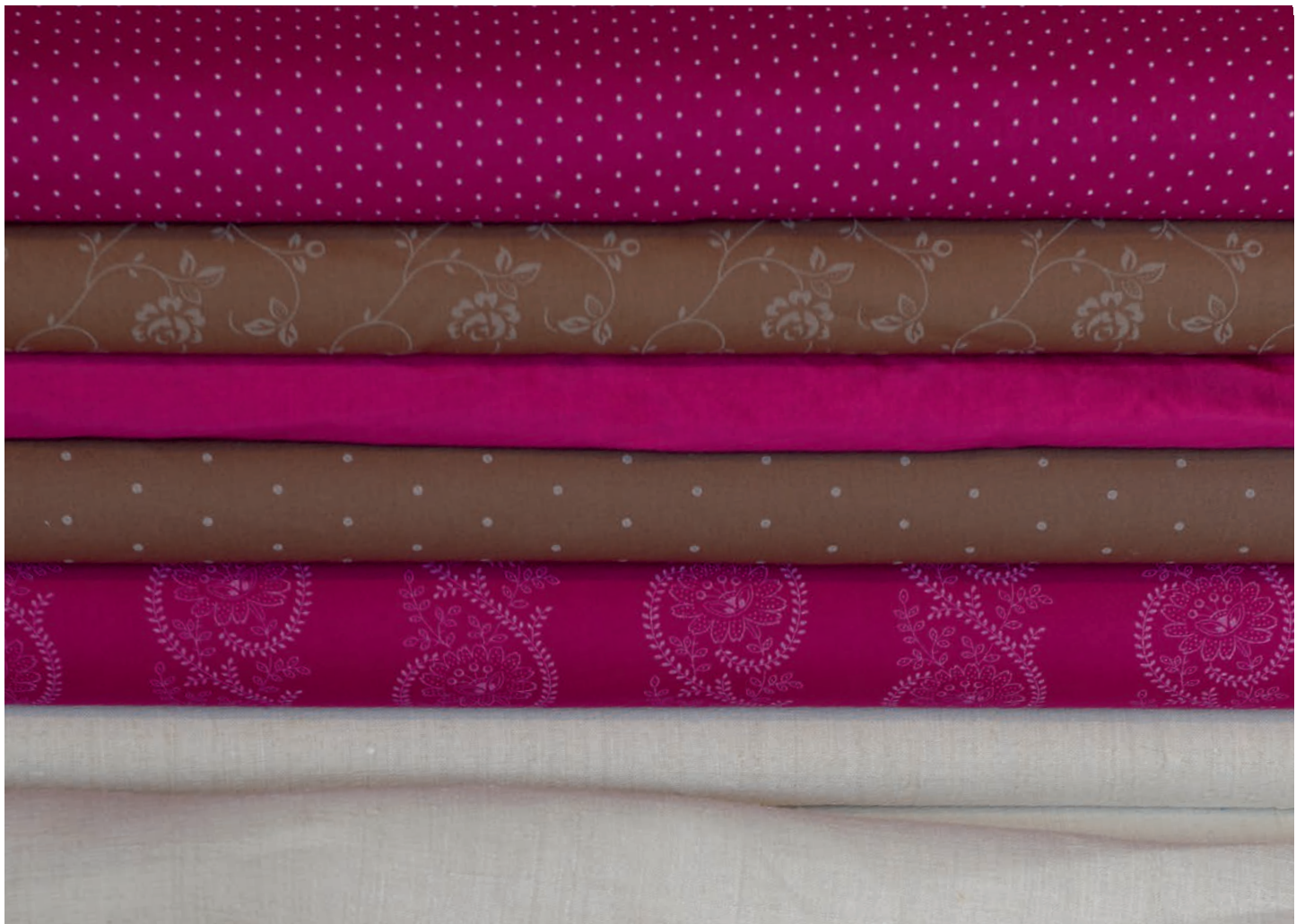
Mit Modeln von Hand bedruckte Baumwolle mit Tupfen, Streifen und in floraler Optik. Farblich passend eingefärbte Perlmutterknöpfe, handbemalte Keramikknöpfe mit Metallrand, gehämmerte silbrige Kugelknöpfe und lackierte Kugelknöpfe mit silbrigem Ornament.