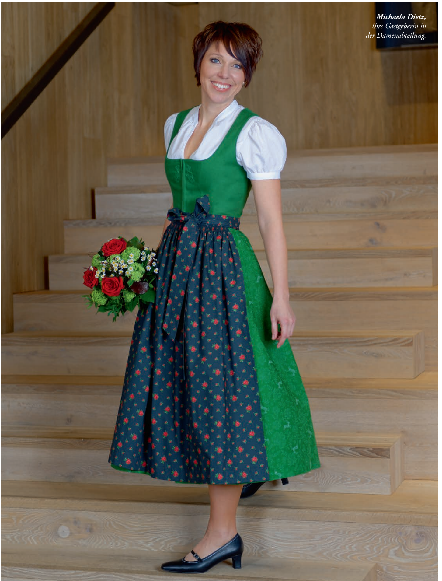
Dirndl mit zwei Schürzen für verschiedene Anlässe. Leinenoberteil mit Lederhosenstickerei und bedrucktem Baumwollrock, 279 €. Stehkragen-Dirndlbluse aus Baumwoll-Piqué, 54,90 €.