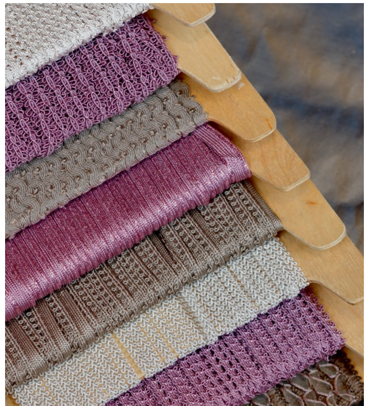
Tafte und Wildseide in Beerentönen kombiniert mit beige und grau. Borten und Bänder in Glitzeroptik.