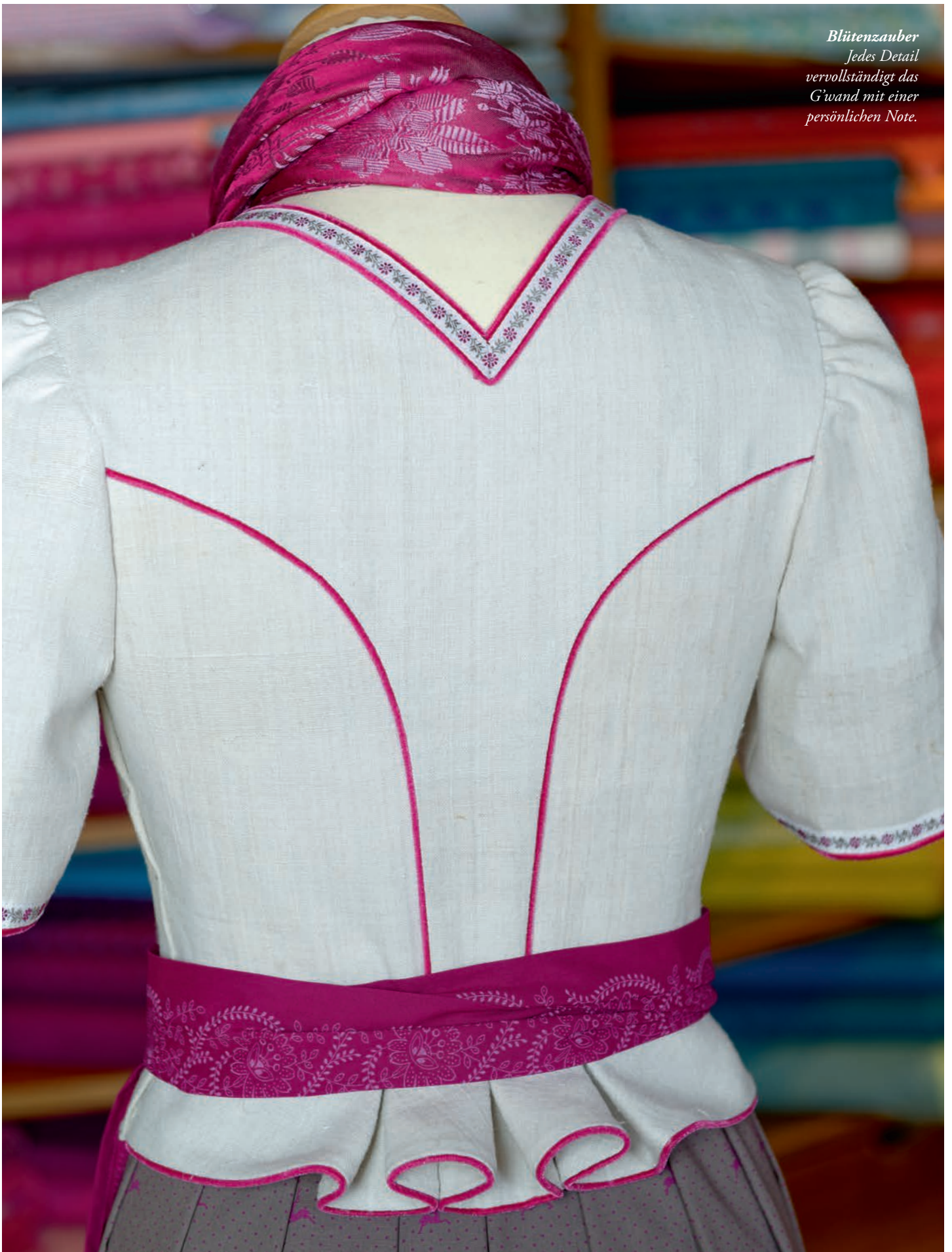
Spencer aus altem handgewebten Leinen, 70 bis 80 cm breit, verziert mit gewebter Borte und pinken Paspolen.

Blütenzauber Jedes Detail vervollständigt das Gewand mit einer persönlichen Note.